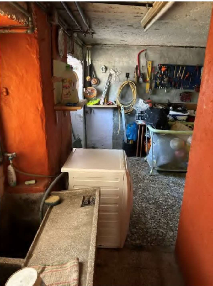
16 locale piano terra