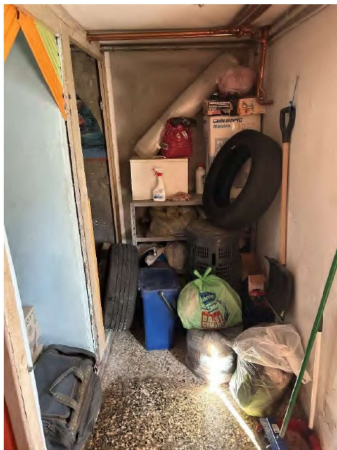
14 ingresso locali terra