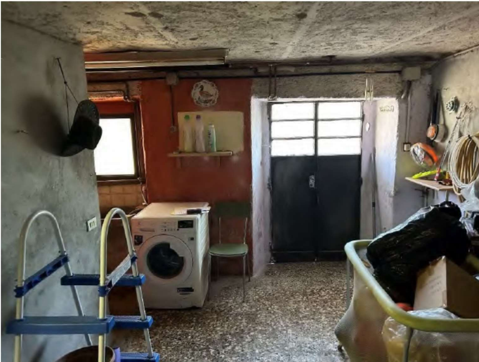
19 locale piano terra