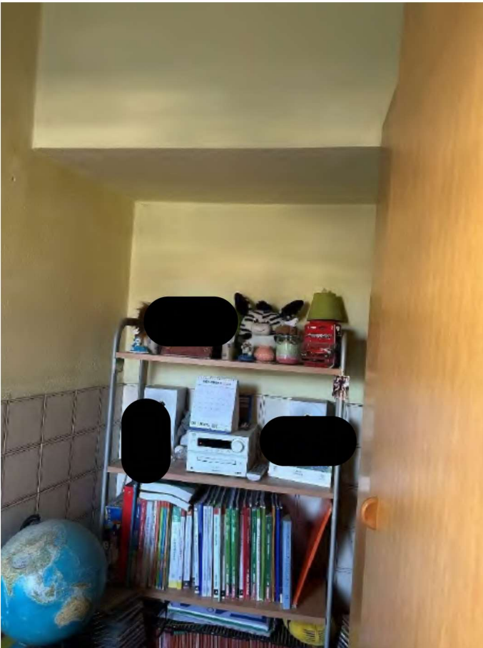
10 locale accanto camera singola