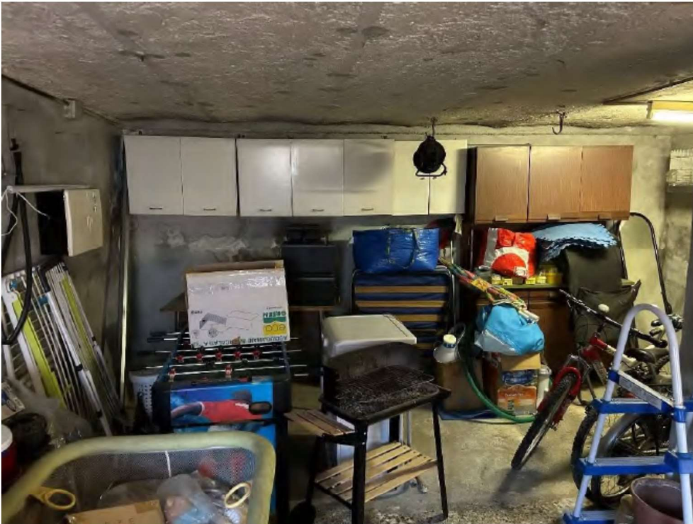
17 locale piano terra