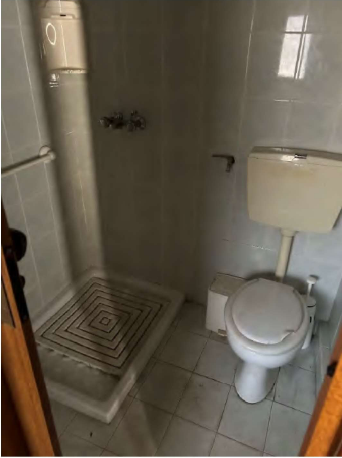
15 bagno piano terra