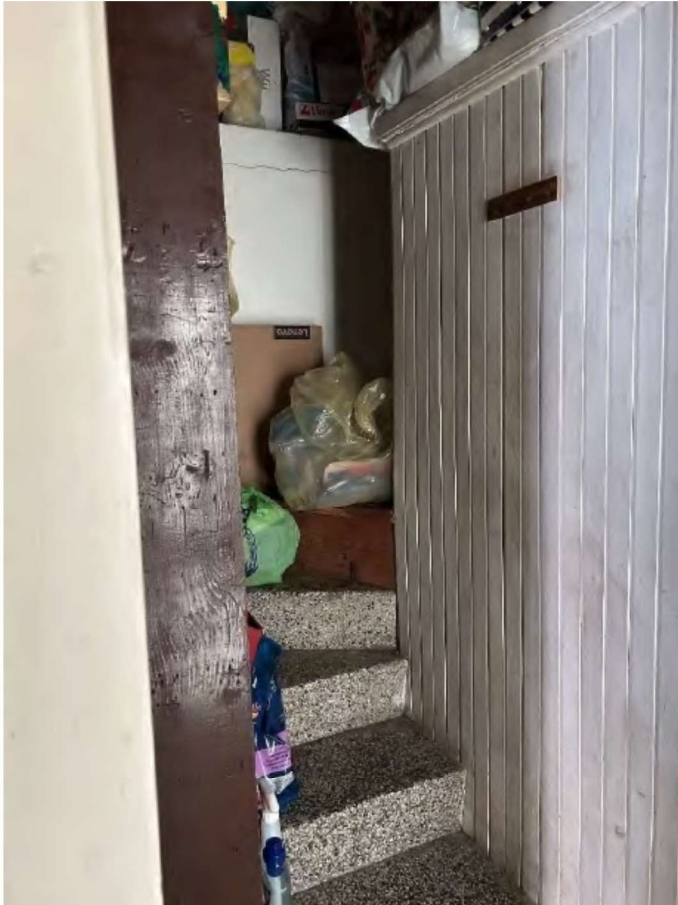
08 scala chiusa ad uso ripostiglio