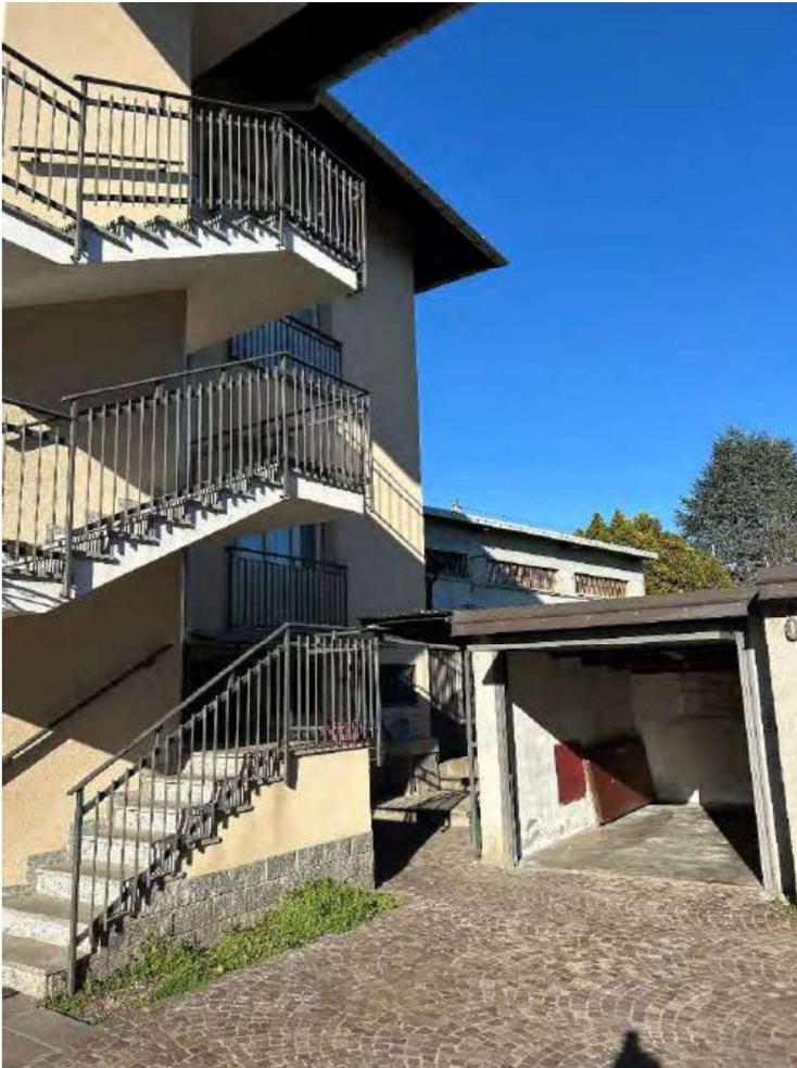
02 Scala di accesso ai piani e vista sul box esterno