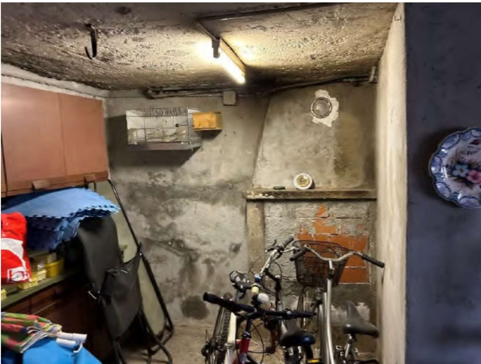
18 locale piano terra