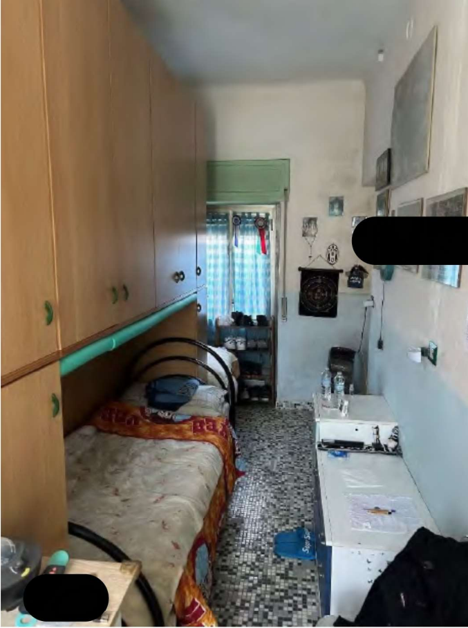
09 camera singola