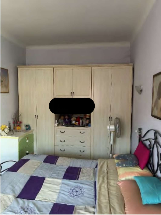
11 camera matrimoniale