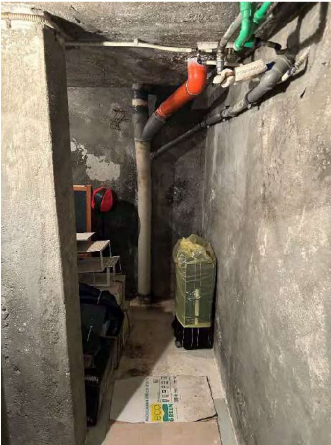
12 locale cantina