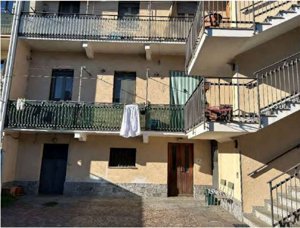
01 Edificio vista esterna