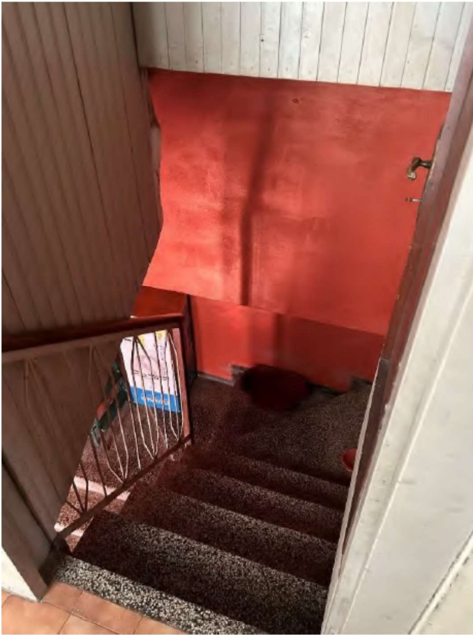
07 scala che conduce a piano terra