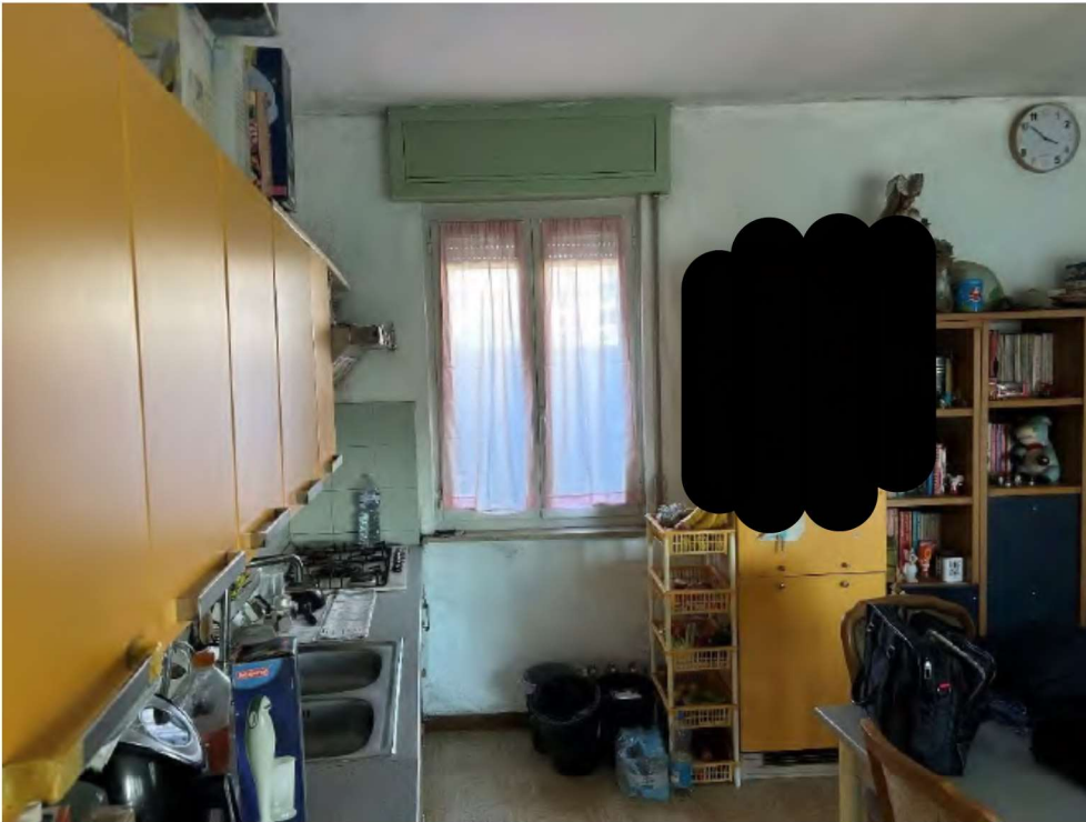
03 Zona cottura/soggiorno