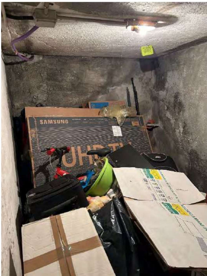
13 locale cantina