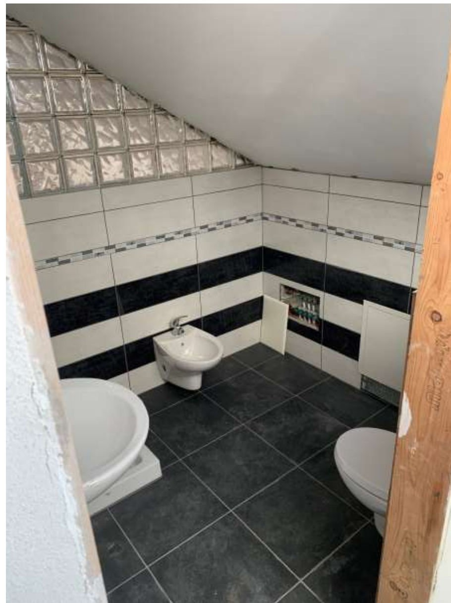
BAGNO ABUSIVO NEL SOPPALCO