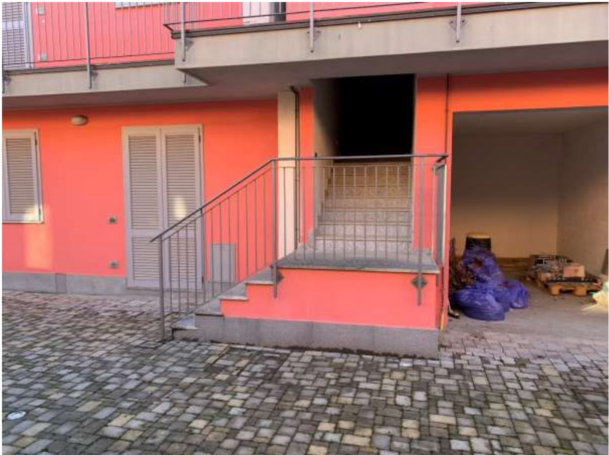
SCALA DI ACCESSO AL PRIMO PIANO