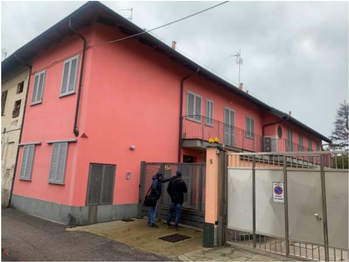
VISTA DALLA STRADA