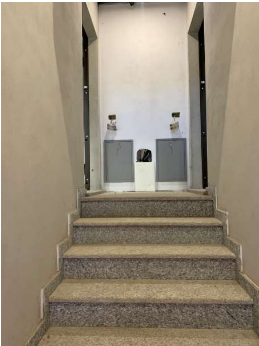
SBARCO SCALA AL PRIMO PIANO