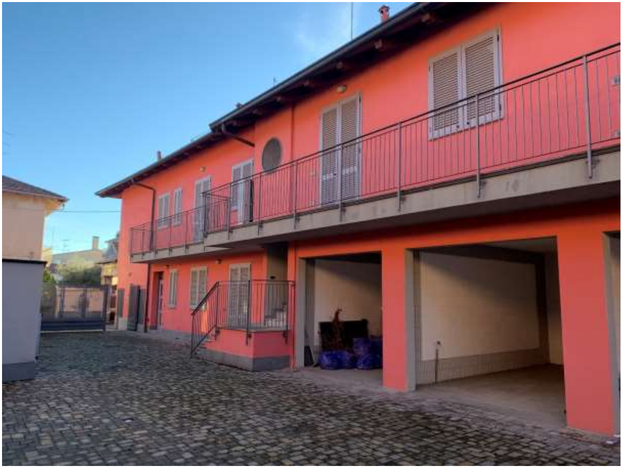
VISTA DALLA CORTE