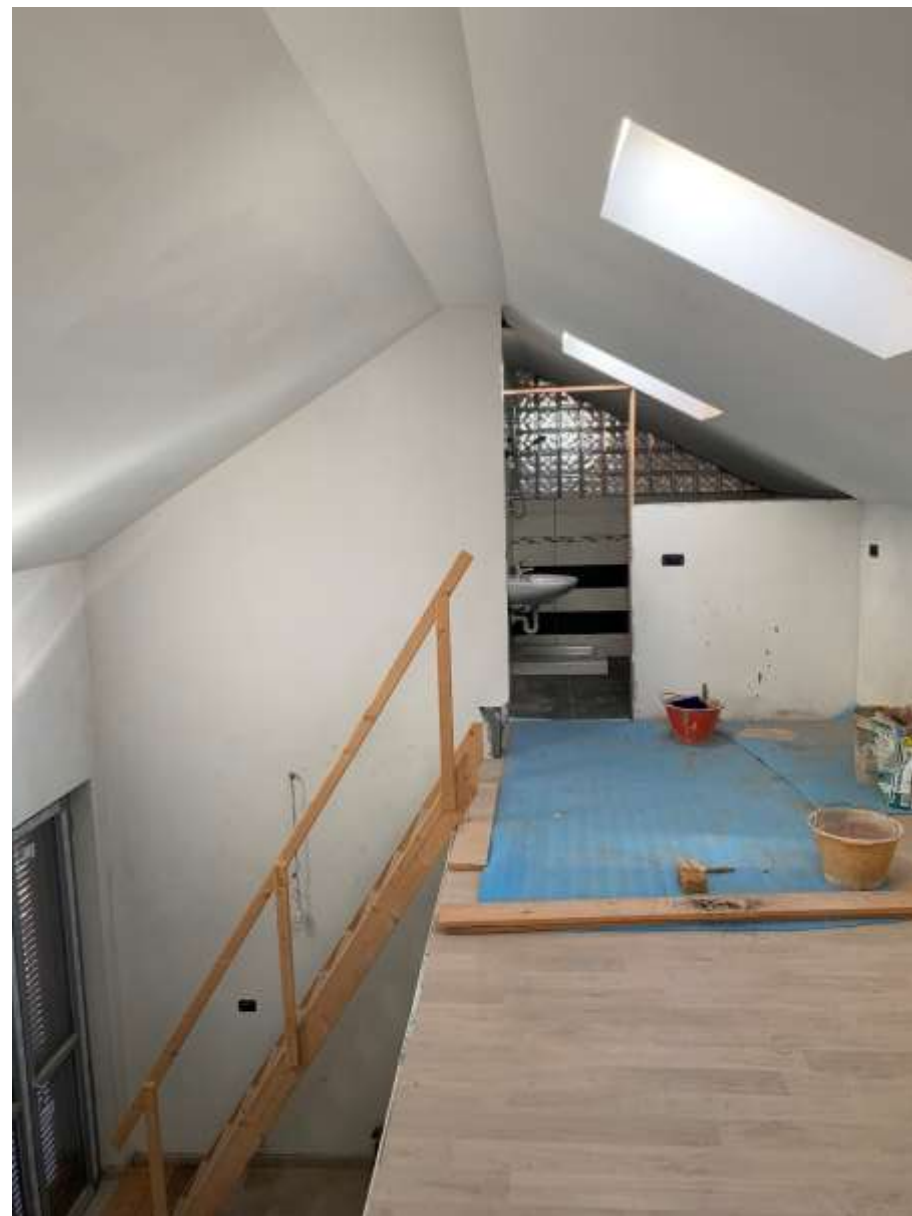
SOPPALCO ABUSIVO SOPRASTANTE IL SOGGIORNO