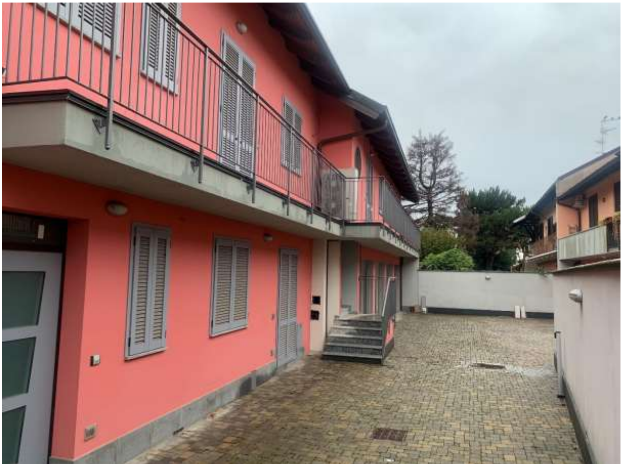
VISTA DALLA CORTE